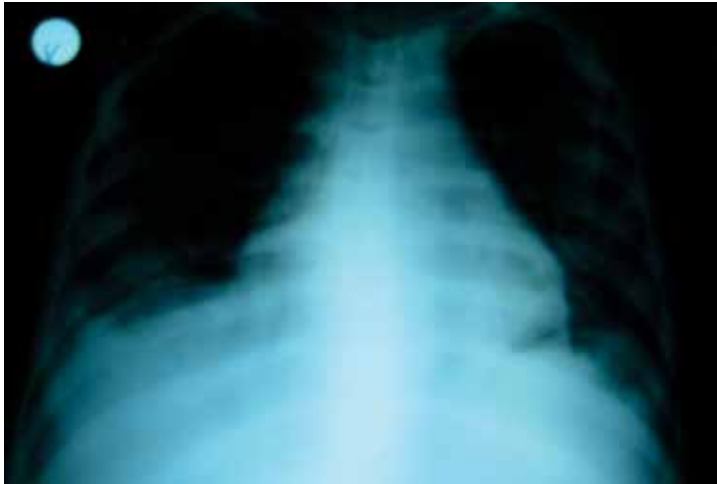
Figura 1. Radiografía de Tórax: Se evidencia un discreto abombamiento de la silueta cardíaca, derrame pleural bilateral escaso y ausencia de compromiso parenquimal