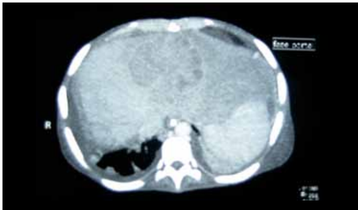
Figura 2. Tomografía abdominal con contraste: Se evidencia líquido ascítico en moderada cantidad y una lesión hipodensa y heterogénea de bordes irregulares en el parénquima hepático, compatible con una colección purulenta.